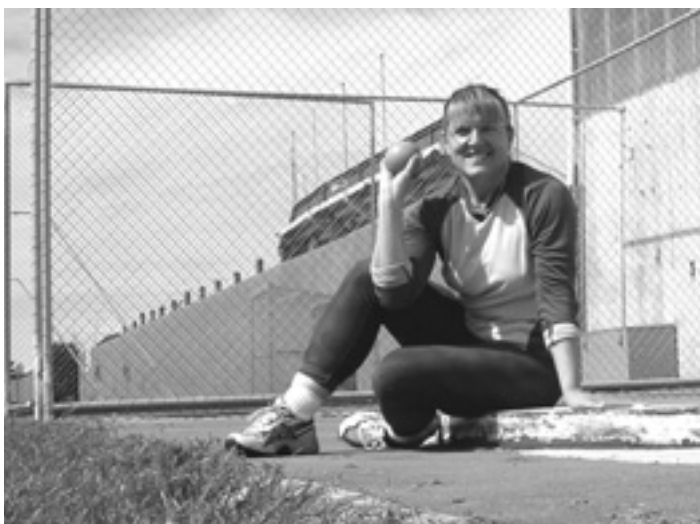
Training in Lyttelton

Ich war von Mitte 1980 bis Ende 2003 Sportredakteurin bei der Südwest Presse in Ulm, berichtete von mehreren Olympischen Spielen, zwölfmal von der Tour de