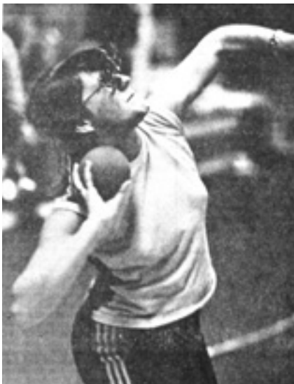
Bezirks-Hallenmeisterin im Kugelstoß 1975

Einiges habe ich ja schon weiter oben erwähnt. Sport, Garten, Vögel beobachten und Fotografieren, Wandern, einsame Winkel des Landes erforschen. Außerdem: Natur, Umwelt, Malen, Schreiben, Reisen. Ich bin in Neuseeland ein ziemlicher "Greenie" geworden, weil die meisten Neuseeländer gar nicht zu schätzen wissen, was sie haben. Die Regierung belohnt Umweltverschmutzer. Wo ein Profit lockt, wird Natur zerstört, vergiftet, verseucht. Jetzt wollen sie in Nationalparks nach Mineralien bohren und wühlen. Die haben noch gar nicht kapiert, dass Touristen nicht nach Neuseeland fliegen, um fuzende Kühe, Kohlebergwerke und Gold-