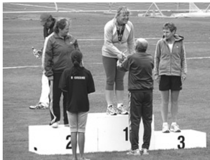
Siegerehrung bei den Masters Games in Dunedin

Vor zweieinhalb Jahren fand mein zweites Comeback statt, weil ich irgendein Ziel brauchte, um mich fürs Training in diesem langweiligen Fitnessstudio zu motivieren. Da entdeckte ich die NZ Masters Games - das sind die nationalen Seniorenspiele. Von dem Wettkampf erhole ich mich heute noch! Nein, im Ernst: Ich gewann drei Goldmedaillen - mit Kugel, Diskus und Speer. Eigentlich wollte ich dieses Jahr auch wieder mitmachen, aber aus unerfindlichen Gründen darf man seine eigenen Geräte nicht benutzen. Ich will aber mit meinem alten Diskus werfen, den ich 1973 von meinen Eltern bekommen habe. Mit dem trainiere ich, und mit dem kann ich so weit werfen wie damals, und hat noch immer das korrekte Gewicht. Die neuen Dinger haben einen breiteren Rand und rutschen mir aus der Hand. Ich bin nicht an den Goldmedaillen interessiert, sondern an der Weite. Wenn ich mit einer guten Leistung verliere, macht mir das nichts aus. Wenn ich mit einer schwachen Weite ge-