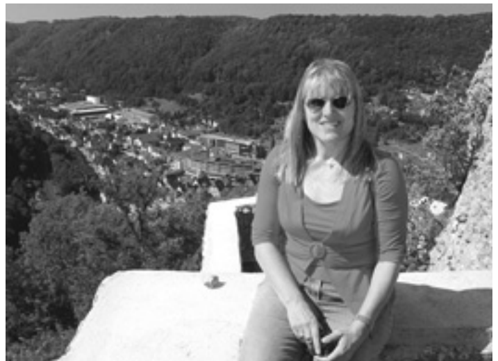
Auf dem Helfenstein im August 2007

nicht weiterbringen. Wir haben nur diese eine Welt. Im Kleinen: Ein kleiner Lotogewinn, der uns mehr Reisen und Renovierungen ermöglichen würde. Wenn ich mich endlich aufraffen könnte, einen Bestseller zu schreiben - und es dann auch wirklich ein Bestseller wird... Alles, was man nicht mit Geld kaufen kann, habe ich: Gesundheit, einen wunderbar relaxten Mann und diesen Traumblick aus dem Haus.